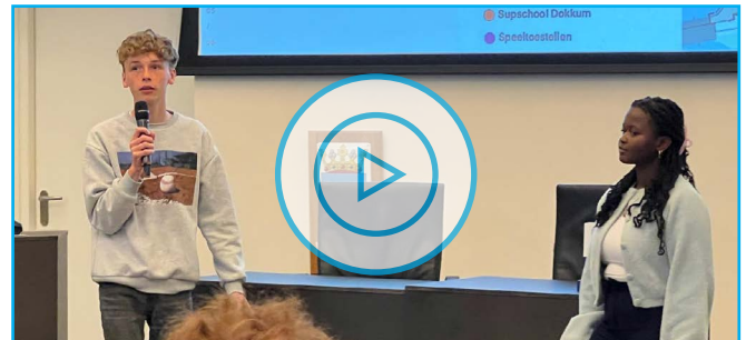
Een video van RTV NOF (klik op de afbeelding om de video af te spelen)

letters DKKM (zoals de bekende landmark, I Amsterdam-letters). De beste ideeën worden samen met de ideeën uit de Stem van Noardeast-Fryslân voorgelegd aan een commissie. Aan deze challenge deden basisschoolleerlingen van CBS de Hoeksteen, De Burgerschool, Dalton Dokkum en MBO-studenten van het Firda mee.