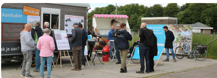
12 juli 2024 stond de Oanhekker bij VV Dokkum om offline ideeën te verzamelen

De hele maand juni konden er ideeën worden ingediend voor het hart van het Harddraverspark in Dokkum. Dat is massaal gedaan. We zijn benieuwd hoe er over deze ideeën wordt gedacht door inwoners van onze gemeente. Tot en met zondag 14 juli 2024 kan er nog steun uitgebracht worden, ook daar wordt al flink gebruik van gemaakt! Een onafhankelijke beoordelingscommissie gaat alle ingebrachte ideeën op bepaalde criteria toetsen. In de commissie zitten mensen van buiten de gemeentelijke organisatie. Zij letten op o.a. de behoefte (o.a. op basis van de verkregen steun), of het idee past bij Dokkum en het Harddraverspark (een park voor iedereen, waar je kunt spelen, georganiseerd en ongeorganiseerd kunt sporten, ontspannen en ontmoeten). Ook wordt er door vakspecialisten van de gemeente naar de ideeën gekeken. Zij letten op de uitvoerbaarheid: is het voorstel nieuw of al aanwezig in Dokkum? Wat is de kosteninschatting? Is het technisch haalbaar? En zijn er nog aandachtspunten voor het onderhoud en beheer? In september wordt bekend welke ideeën een plek krijgen in het park. Meer hierover lees je in de volgende nieuwsbrief!