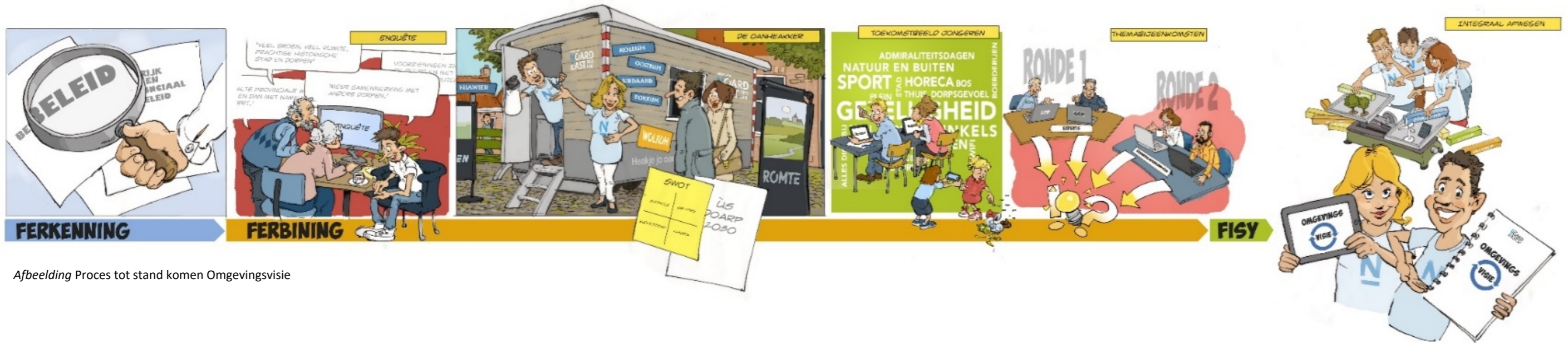
Afbeelding Proces tot stand komen Omgevingsvisie