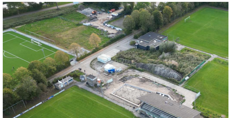
De funderingswerkzaamheden zijn gestart.

Dat de bouw begonnen is, is duidelijk. Op dit moment is de aannemer bezig met de fundering. Daarna kunnen de eerste muren worden gezet. Eind januari moet het bouwwerk wind- en waterdicht zijn. Iets begint het installatiewerk. En dan is in april 2025 de oplevering. “Vanaf dan moeten we met een groep vrijwilligers zelf aan de slag met het verven, het sanitair en het inrichten van het clubgebouw. We willen rond de bouwvak klaar zijn. Dan kunnen we bij de start van het nieuwe voetbalseizoen een openingsfeest organiseren.”