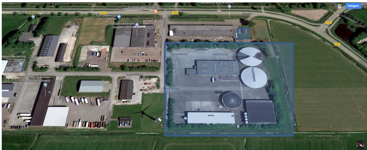
Afbeelding 5 – Industrieterrein

De inrichting is gelegen op een industrieterrein (afbeelding 5) en omringd door een groensingel. De openbare weg en de inrichting worden gescheiden door brede landerijen aan de ene kant en andere bedrijven aan de andere kant (afbeeldingen 6 en 7).