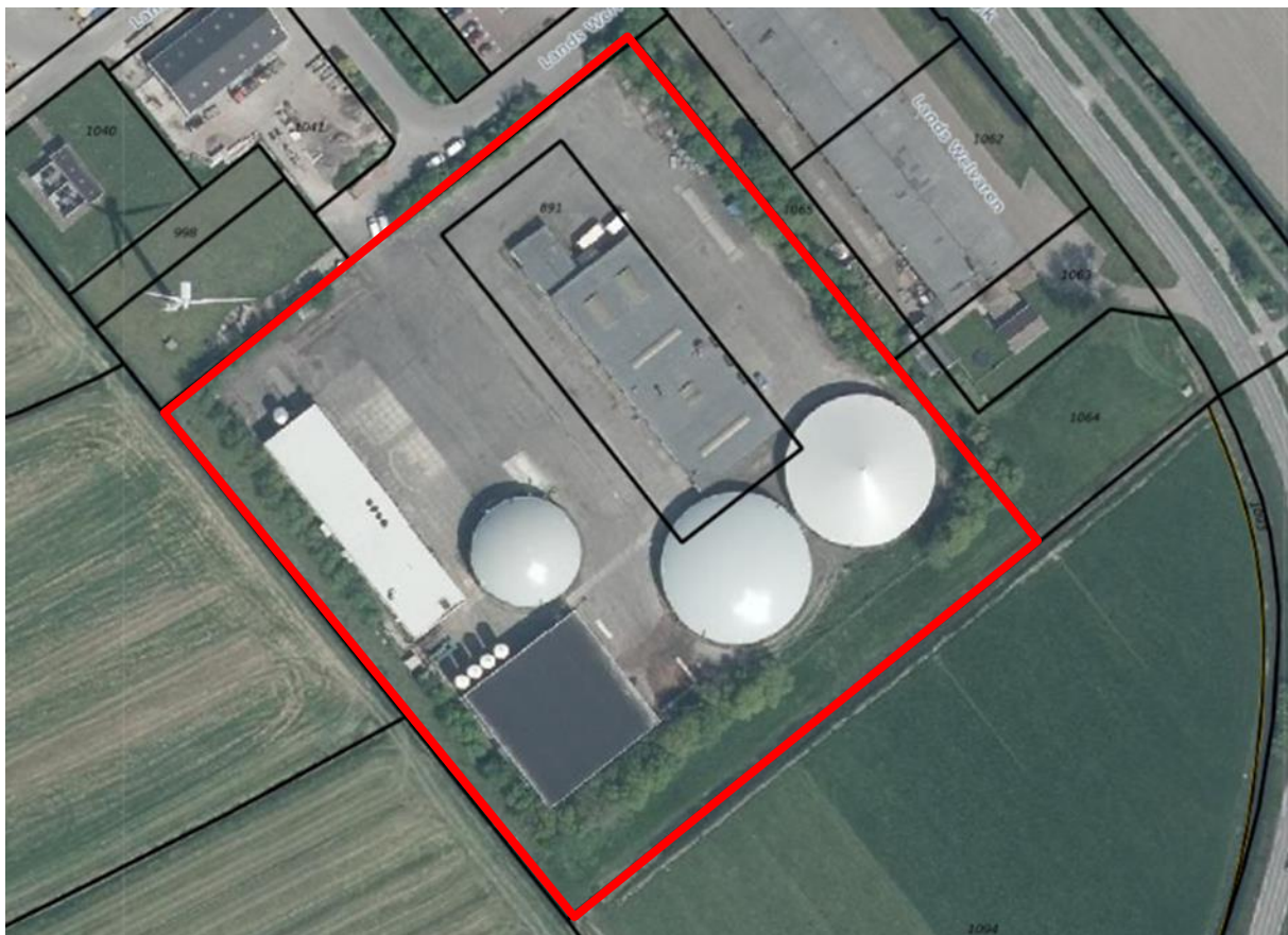
Afbeelding 1 Betrokken percelen (Bron: www.kadasterdata.com , d.d. 14-05-2019) en grens inrichting (in rood)

De inrichting is gelegen aan ■■■■■■■■■■ ■■■■■■■■■■ te ■■■■■■■■■■. De revisie heeft betrekking op de volledige inrichting, omvattende de volgende kadastrale percelen: Gemeente ■■■■■■■■■■ Sectie E, nummers 891 en 892 (weergegeven in afbeelding 1).