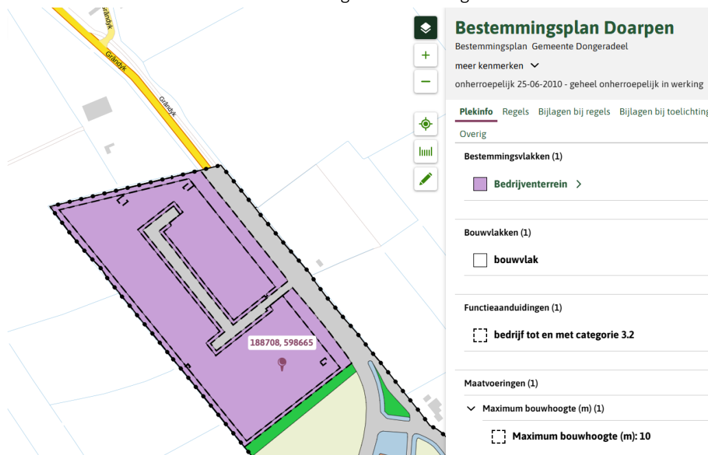
Afbeelding 3 - Uitsnede bestemmingsplan

Het geldende bestemmingsplan is het bestemmingsplan Doarpen met identificatienummer NL.IMRO.0058.BPDRP2009-OH01 van de gemeente Dongeradeel.