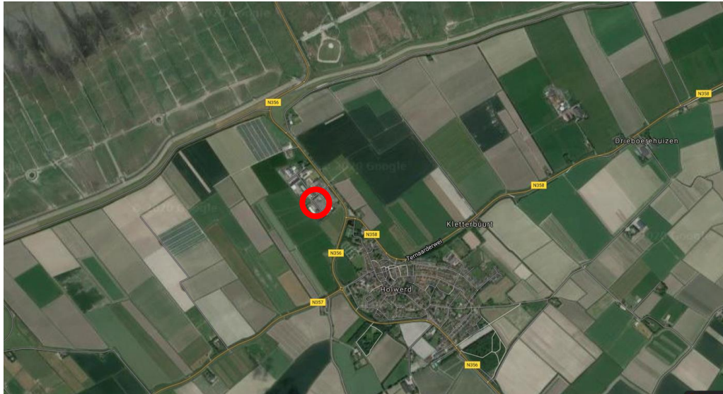
Afbeelding 2 – Locatie inrichting

█ is gelegen aan █ te █ op het bedrijventerrein Grândyk. Het bedrijventerrein ligt ten noorden van █ langs de ontsluitingsweg naar de veerterminal. De dichtstbijzijnde woning van derden ligt op het bedrijventerrein, aan de Grândyk 1 op circa 20 m van het terrein van de inrichting. Overige bedrijfswoningen op het bedrijventerrein liggen op grotere afstand aan de Grândyk 3A en █. De dichtstbijzijnde woningen buiten het bedrijventerrein liggen aan de Grândyk 5 (agrarische bedrijfswoning), Fiskwei 1 (reguliere woning) en Tsjerkestrjitte 24 (reguliere woning). Aan de Fiskwei 30 ligt een pand met maatschappelijke bestemming.