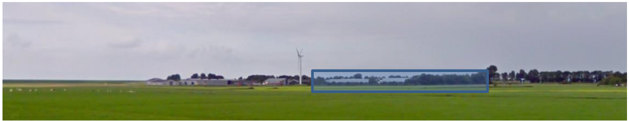
Afbeelding 7 – Aanzicht vanaf de openbare weg (Ljouwerterdijk-N356)